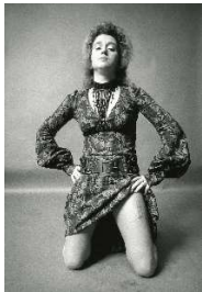
Valie Export: Body Sign B (1970)

(Für diese speziell für SSL-Studierende organisierten Seminare bedarf es keiner Anmeldung im Zeus)